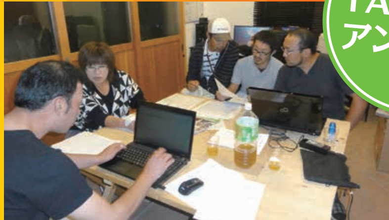
アンケートの集計作業 (10月4日)