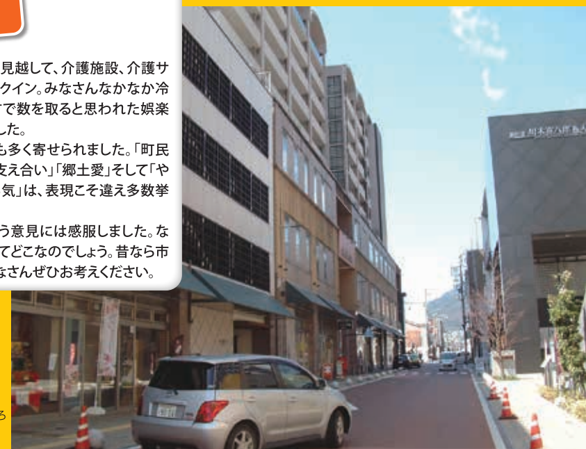
高森町以外で住みたいところナンバーワンの飯田市。写真は中心市街地・丘の上

全体の傾向として、個性ある店、ほかにはない特色をもった店の名が挙がったように感じます。「地域に根ざして固定ファンがいる」「差別化ができてい」店舗が、高森町にはまだ健在です。