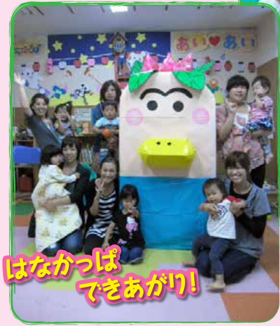
はなかつぱ できあがり!