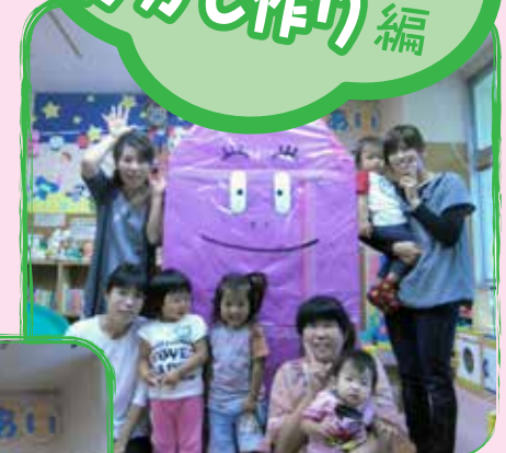
あんしん市場の 「案山子まつり」に出展