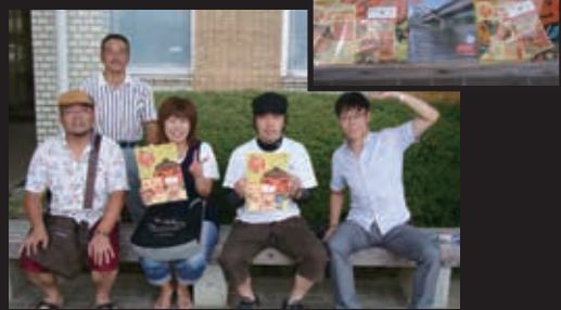
高森町公認ゆるキャラ“柿丸くん”グッズで、わらしべ長者に挑戦 (最終的にどんなものになるのか…?)

ボス 「今回はわらしべ長者だ!」 隊長 「は? なんすかソレ?」 ボス 「わらしべだよ! わらしべ!!」 隊長 「言ってることはわかりますけど、意味がわかりません…」 ボス 菓柿とはアブが結び付けられた菓しべ ↓蜜柑↓反物↓馬↓屋敷つて やっすよな?」 隊長 「そっだよ。それそれ!」 ボス 「なんでやるの? 意味が分りませんが…」 隊長 「町民同士のつながりや紹介も含めて、やることに意味があるんだよ!」 ボス 「……(ホントはTAKARTの知名度を上げる宣伝活動のくせに)」 隊長 「今の時代“わらしべ”じゃ誰も欲しい奴なんかないから、柿丸くんグッズを用意しておいた。これを持っていつて来い!」 「了解」