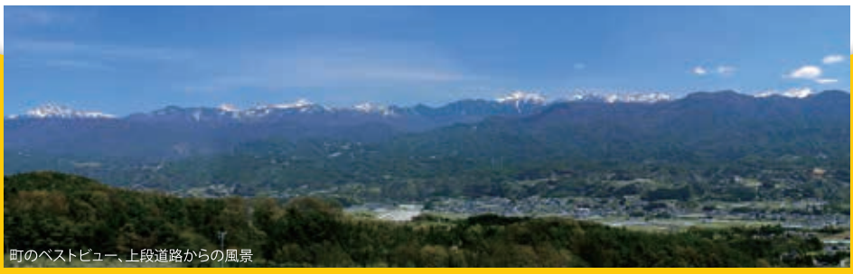
町のベストビュー、上段道路からの風景