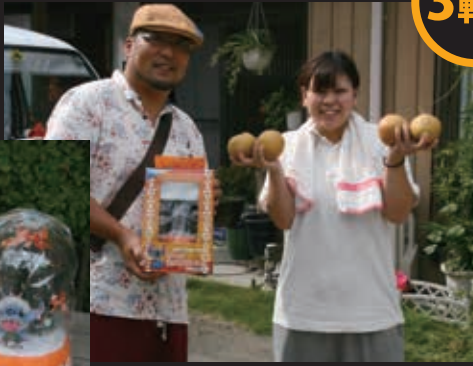
梨と交換して喜んでいただきました。