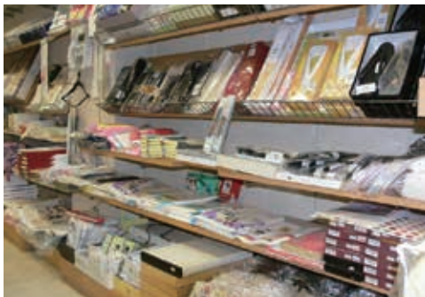
パース内 着付け小物の コーナー