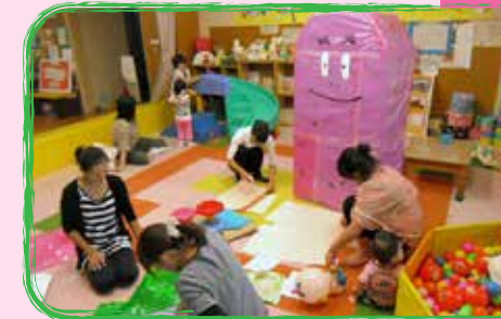
昨年頑張ってくれた バーバパパよ ありがとう。 今年作成するのは 「はなかつぱ」