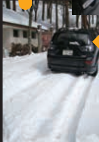
で、すぐに進めなくなる。