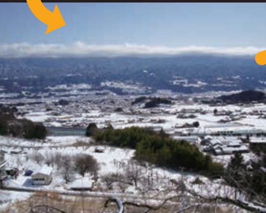
引き返す途中の月夜平から雪の高森町を撮影