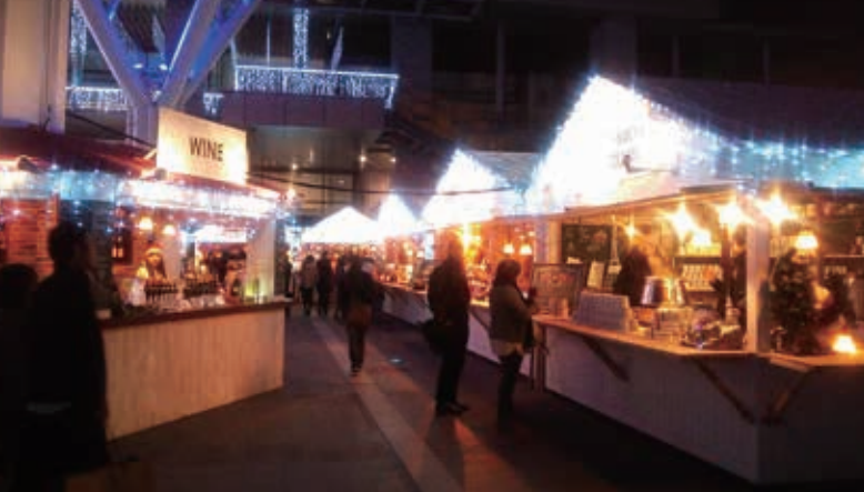
駅前がこんなふうに賑わったら素敵だと思う(TAKART)

駅前を新たな感性でまちづくりするプロジェクト案にブレイクスルーしました。コミュニティ