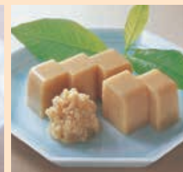
こうや豆腐の寄せ煮(ミキサー)