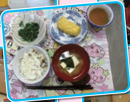
献立：大豆ごはん だし巻き卵 ほうれん草のごま和え 豆腐とわかめのおみそ汁