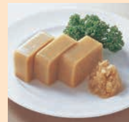
肉じゃが(ミキサー)