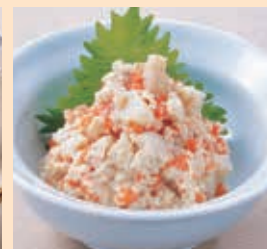
人参・ごぼう・里芋の白和え(きざみ)